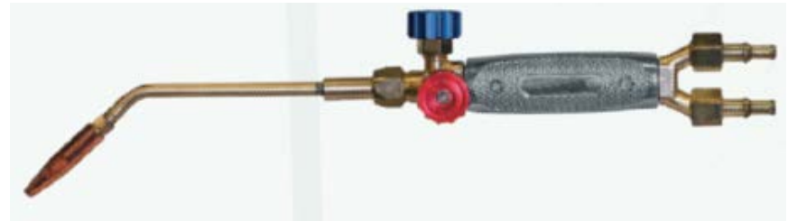
КЕДР Г-2А Малютка