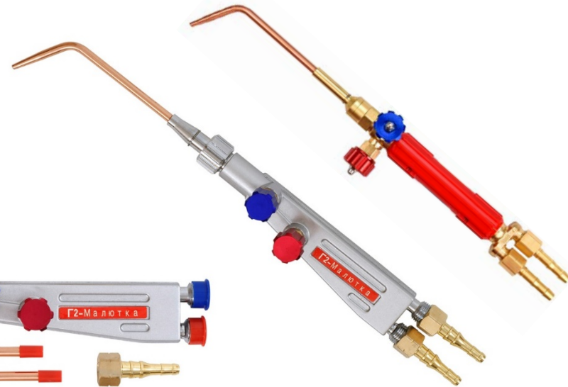
КЕДР Г-2 Малютка