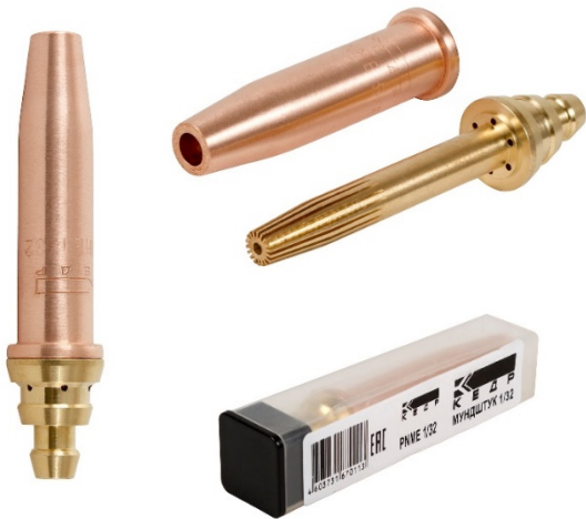
Мундштуки для резаков серии РЗП: