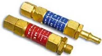
Обозначение 1К или 1Г – на выход редуктора