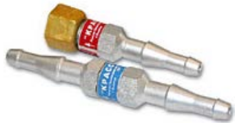
Обозначение 3К или 3Г – на вход резака/горелки

Предохранительные устройства устанавливаются как на вход резака или горелки, так и в разрыв рукавов; конструктивно выполнены с правыми присоединительными (кислород, маркируются синим цветом) или левыми (горючий газ, маркируются красным цветом) резьбами.