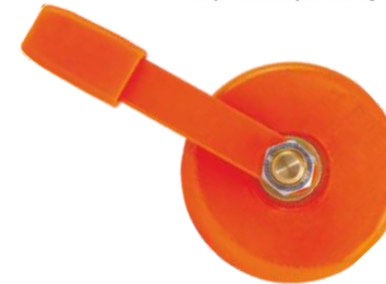
Клемма заземления магнитная МКЗ-400Р (Арт. 5398)

Сила прижима в осевом направлении, не менее: 3,5 кг