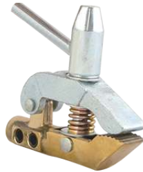
Клемма-струбцина VARTEG C-600 (Арт. 7135)