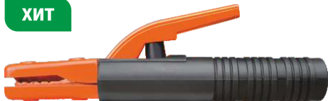
FoxWeld EH-300A (Арт. 4474) FoxWeld EHM-300A (Арт. 5937)