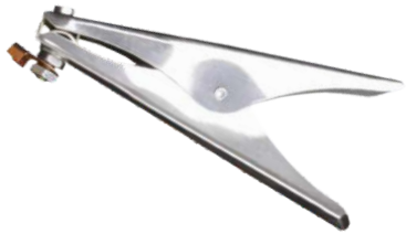
Клемма Varteg EC-500 (Арт. 5883)