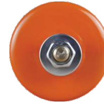
Клемма заземления магнитная МКЗ-200 (Арт. 5397)