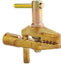
Клемма-струбцина VARTEG C-600 Макси (Арт. 7136)

Наибольшая величина раствора губок: 45 мм