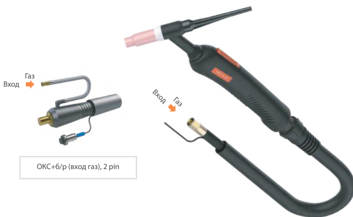
ОКС+6/р (вход газ), 2 pin