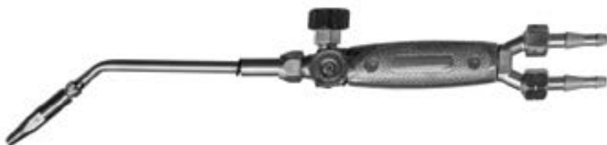
Рис.1- Общий вид горелки

Горелка состоит из ствола и комплекта наконечников. Ствол горелки имеет регулировочные вентили кислорода и пропан-бутана. К стволу по резиновым рукавам